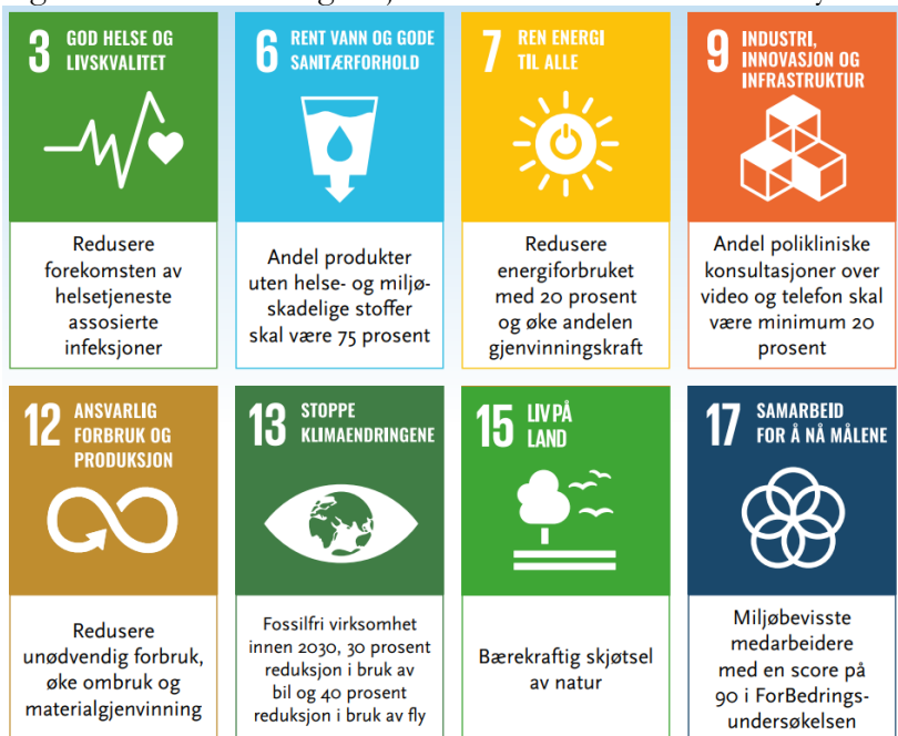
Figur 6: Felles klima- og miljømål vedtatt av de fire RHF-styrene høsten 2021, oppdatert i 2024.

Felles klima- og miljømål for spesialisthelsetjenesten kommer i tillegg til lokale mål i helseforetakene. Helseforetakene har ulike utgangspunkt for potensiell reduksjon av CO 2 e-utslipp. Det er derfor hensiktsmessig at hvert enkelt helseforetak vurderer hvilke tiltak som iverksettes for å redusere 40 prosent utslipp innen 2030, jf. utvikling av utslippbaner. Statens veileder for samfunnsøkonomiske analyser skal benyttes for å sikre gode kost-nytte vurderinger.