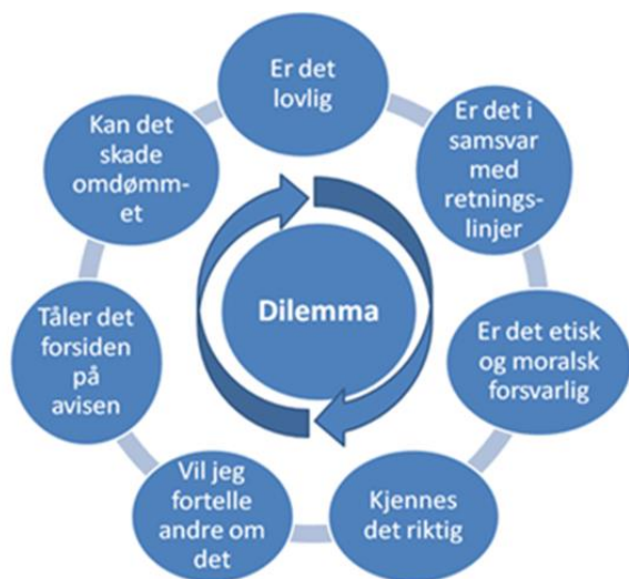
Figur 7: Dilemmasirkelen, kilde: Kvalnes, Øverenget 2012

hensiktsmessig verktøy for å øve opp den enkeltes evne til å vurdere etisk forsvarlighet. Dilemmasirkelen kan benyttes når de ulike problemstillingene diskuteres.