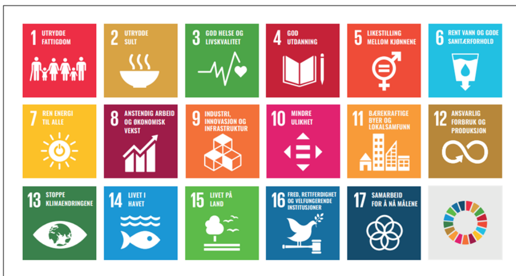
Figur 1 FNs bærekraftsmål.

Bærekraft defineres av FN til å inkludere tre dimensjoner: klima og miljø, økonomi og sosiale forhold. FNs bærekraftsmål er verdens felles arbeidsplan for å utrydde fattigdom, bekjempe ulikhet og stoppe klimaendringene innen 2030, se figur 1.