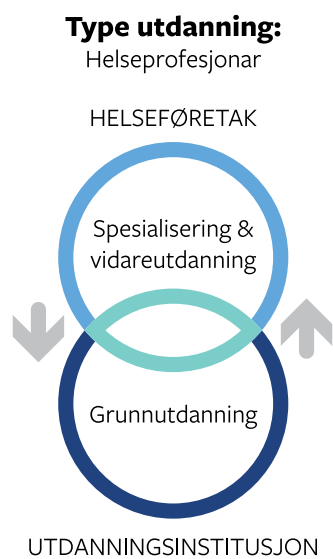
Figur 1 (ovenfor) illustrerer samhandlinga mellom utdanningsinstitusjonar og helseføretak innanfor helseprofesjonar. Begge er gjensidig avhengige av kvarandre for å få til eit godt samarbeid