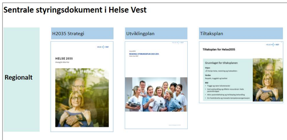
Figur 1: Oversikt over strategiske dokument i Helse Vest

Styret i Helse Vest vedtok den regionale strategien, Helse2035, i mai 2017. I etterkant utarbeidde Helse Vest ein regional tiltaksplan, som styret vedtok i februar 2018. Tiltaksplanen gjekk inn som ein del av Regional utviklingsplan 2019–2035, og blei styrebehandla desember 2018.